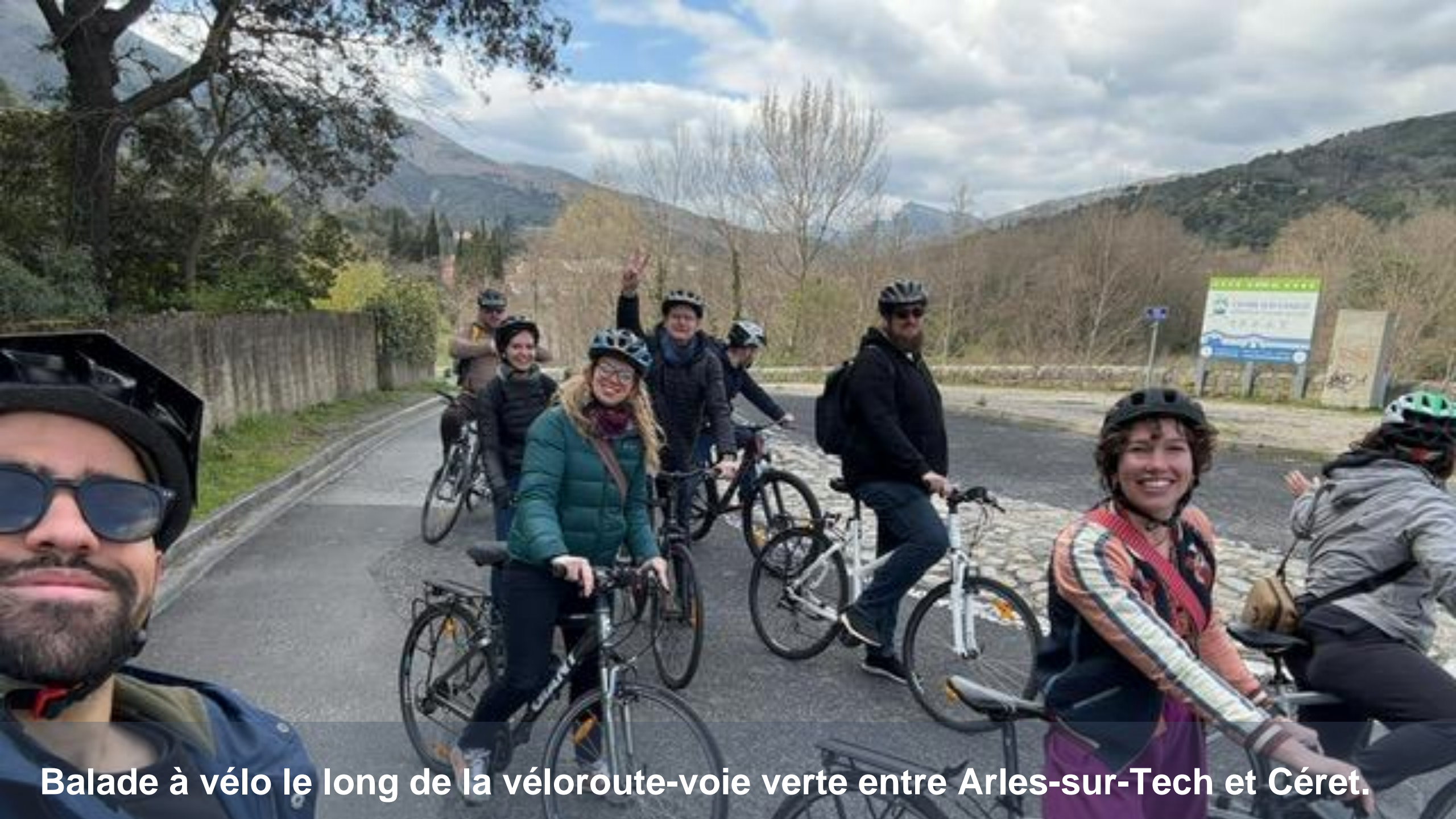
Balade à vélo le long de la véloroute-voie verte entre Arles-sur-Tech et Céret.